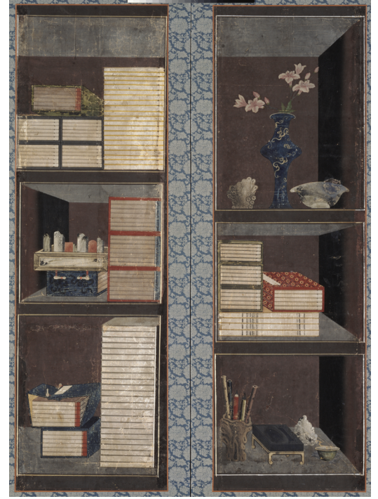
Paravent à six panneaux (détail), dynastie Yi ou Choson (1392-1910), Ancienne collection Lee U Fan, Paris, Guimet - musée national des arts asiatiques

Exposition 16 septembre 2026 – 4 janvier 2027