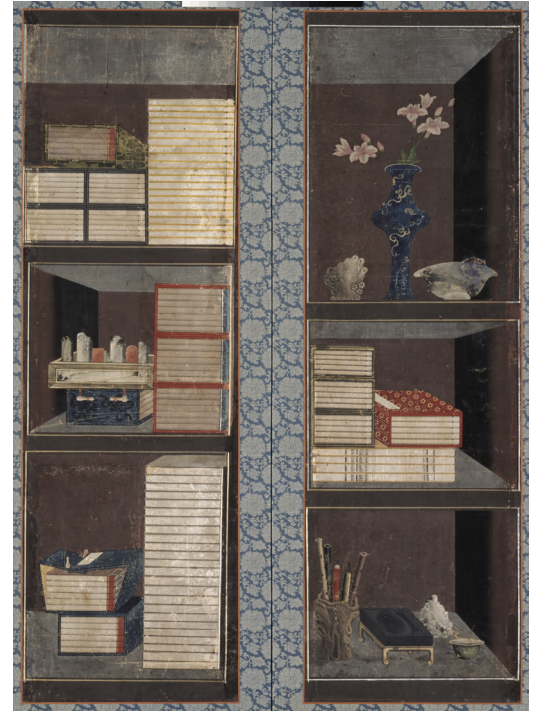
Paravent à six panneaux (détail), dynastie Yi ou Choson (1392-1910), Ancienne collection Lee U Fan, Paris, Guimet - musée national des arts asiatiques

Exposition 16 septembre 2026 – 4 janvier 2027