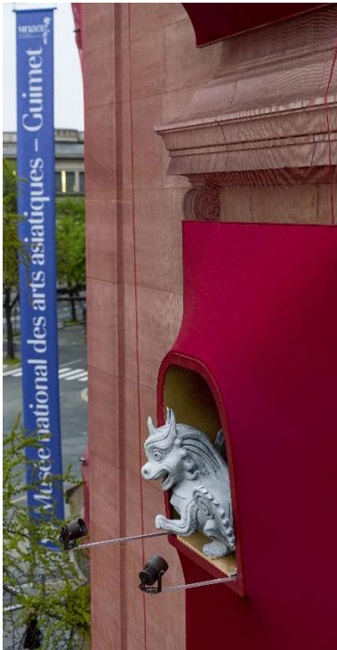
Gardiens du Temps