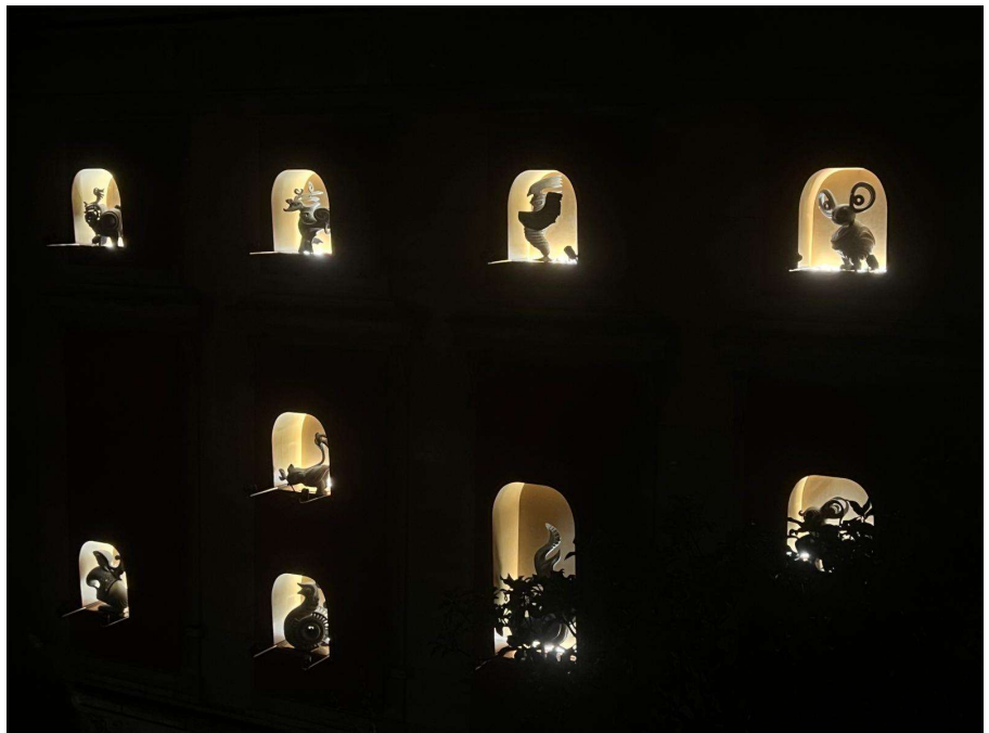
Gardiens du Temps

Grâce à un dispositif visuel et sonore à l'impact exceptionnel, utilisant toutes les ressources de la technologie, le musée Guimet devient un lieu de ralliement autour de l'art. C'est à une communion par l'art et autour de l'art que nous appelent les douze créatures fabuleuses en nous invitant à pénétrer à l'intérieur du musée.