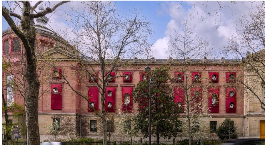
Gardiens du Temps

« Si nous comprenons notre propre esprit, et les choses qui tentent de s'exprimer à travers notre esprit, nous touchons les autres, non pas parce que nous avons compris ces autres ou réfléchi à eux, mais parce que toute vie a la même racine. » W. B. Yeats