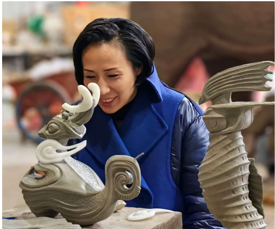
Jiang Qiong Er (DR)

Jiang Qiong Er a été honorée par de nombreuses distinctions internationales, parmi lesquelles figure son inclusion dans la liste des 25 Chinois les plus influents du monde, établie par Forbes. En reconnaissance de sa contribution exceptionnelle aux échanges culturels entre la Chine et la France, le gouvernement français l'a nommée Chevalier dans l'Ordre des Arts et des Lettres de la République française. Elle a également été sélectionnée comme l'une des « 50 personnalités des 50 ans », et a reçu la distinction de Chevalier dans l'Ordre National du Mérite de la République Française. En outre, pour ses efforts visant à promouvoir l'intégration culturelle entre la Chine et l'Italie, le gouvernement italien a décoré Jiang Qiong Er de l'Ordre de l'étoile de la solidarité italienne.