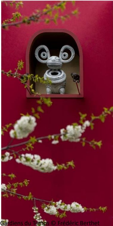
Gardiens du Temps