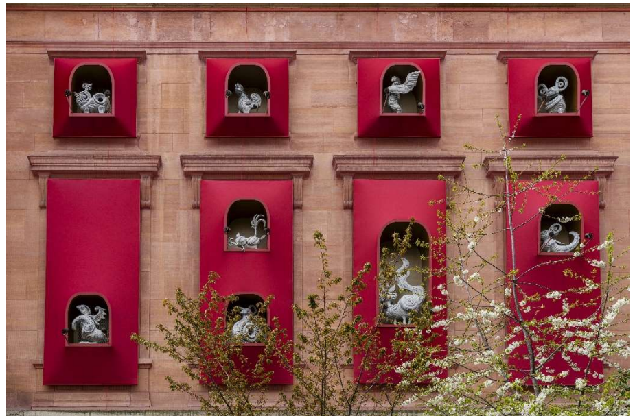
Gardiens du Temps © Frédéric Berthet

Au rythme du cycle du jour et de la nuit, des quatre saisons, des moments de fête et de réjouissances, elles se manifestent sur la façade, prennent vie, entrent en interaction avec le public sur la place d'Iéna qui devient un point de rencontre à la fois poétique, convivial et ludique.