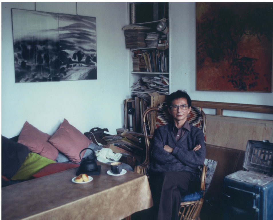
Portrait de T'ang Haywen

Des créations inédites ainsi que des éléments d'archives, qui avaient été conservés dans le secret de son atelier, lèvent un voile sur l'intimité de cet artiste fondamentalement épris de liberté et de dépouillement, reflétant son inclination pour l'ascétisme oriental. Peintre itinérant, T'ang Haywen privilégiait les formats transportables dans son carton à dessin. Ces œuvres originales et touchantes sont montrées au public pour la première fois, telles que des cartes postales envoyées à ses amis et connaissances, des carreaux de céramique peints, vestiges d'un séjour à San Francisco en 1965, de petits portraits monochromes et des pages de carnets de croquis.