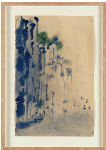
Sans titre, 1955-1960, gouache sur papier Annonay, MA 13349

Formé à la peinture occidentale, ses carnets de dessin révèlent qu'il visite régulièrement les musées parisiens, dont le musée Guimet, et qu'il s'inspire de la ville dans des paysages urbains croqués rapidement au stylo à bille. Lettré moderne, insatiable curieux des arts et cultures de l'Occident, il trouve à Paris sa vocation de peintre. Adeptes de la philosophie taoïste enseignée par son grand-père, il y vit libre des contraintes matérielles ou sociales. Il écrit à son frère en 1958 : « J'ai trouvé ma vocation dans la peinture... je ne pensais pas que cela puisse plaire à nos parents... c'est une affaire très grave, où il ne peut être question, honnêtement, de chercher la réussite pour elle-même... La réussite doit, pour être véritable, être tout à fait sincère. Une fois qu'un peintre s'est trouvé, alors il peut travailler pour les autres, il le doit, mais il ne peut pas le faire avant... Je ne pourrai ni ne veux abandonner cette vocation. »