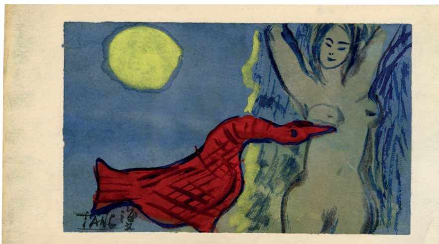
Carte de vœux, 1955-1960, encre sur papier, MA 13395

Des formats plus importants, présentés dans l'exposition, permettent à T'ang Haywen de donner à voir des paysages abstraits à l'encre monochrome, tandis que les petits formats, papiers pliés, diptyques et triptyques des années 1980-1985 montrent une pleine maîtrise de son geste et de son pinceau. Ces œuvres expriment le dynamisme et la tension taoïste entre le plein et le vide, le noir et le blanc, le monde visible et le monde de la pensée.