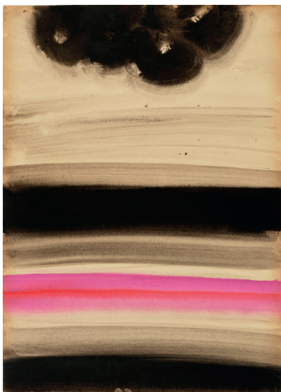
Sans titre, 1965, aquarelle, gouache et encre sur carton Kyro, MA 13413 © Tang Haywen / ADAGP, Paris, 2024

S'il était un grand voyageur, il fit de la France sa terre d'élection, et de l'art occidental une puissante source d'inspiration, tout en restant profondément chinois ; une dualité qui l'habita pendant toute sa vie d'artiste. Initié à la calligraphie par son grand-père au Vietnam, sa peinture s'impose comme un vibrant trait d'union entre la tradition asiatique de l'encre monochrome pure et l'influence occidentale de la couleur éclatante, entre figuration et abstraction, ou plutôt la « non-figuration » comme il préférerait la décrire.