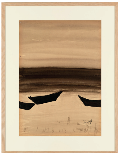
Sans titre , 1967, encre sur carton Kyo, MA 13414 © T'ang Haywen / ADAGP, Paris, 2024